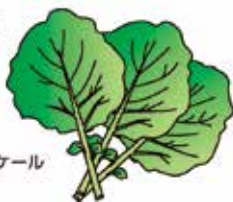
コラード系ケール

青汁の原料のケールは、ベータカロテン、ビタミンC、カルシウムやカリウムなどのミネラル、食物繊維など栄養価が高いスーパーフードです。 【栽培期間】 ケールは冷涼な気候を好み、生育適温は20度前後ですが高温や低温に強く、中間地では7月上旬〜8月上旬に種まきすれば、2カ月後から翌春まで長期に収穫できます。 【品種】 葉の形や色、草姿によりさまざまな品種群があります。 ・コラード系ケール 丸みのある楕円形の葉と、表面に