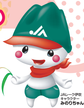
JAレーク伊吹 キャラクター みのりちゃん