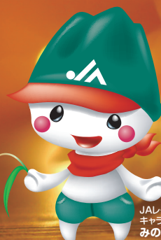
JAレク伊吹 キャラクター みのりちゃん